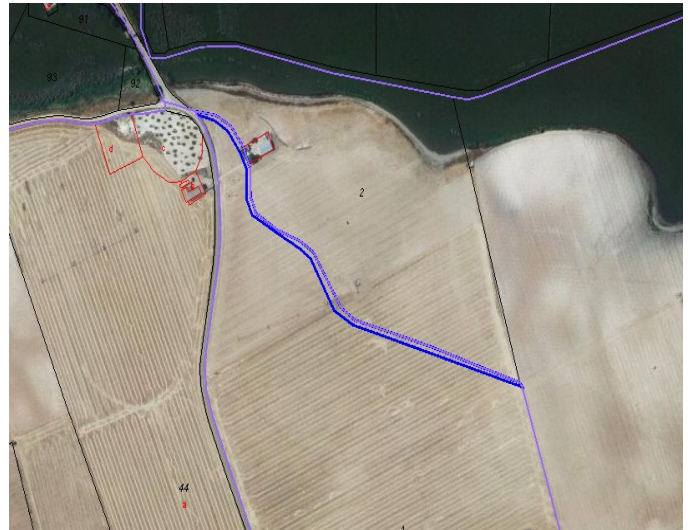
ortofoto del PNOA

- La parcela 9009 del polígono 144 se corresponde con un tramo del Camino de Camino de los Bataneros o Albillares, el cual figura en la Ordenanza Reguladora de Caminos Rurales de Daimiel, como Camino de segundo orden, por lo tanto, con un ancho total de 7m. (5. de calzada y uno de cuneta a cada lado), la descripción es la siguiente: